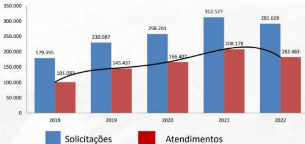
Solicitados e Atendidos não COVID | Central Estadual de Regulação – janeiro e fevereiro 2021 a 2023